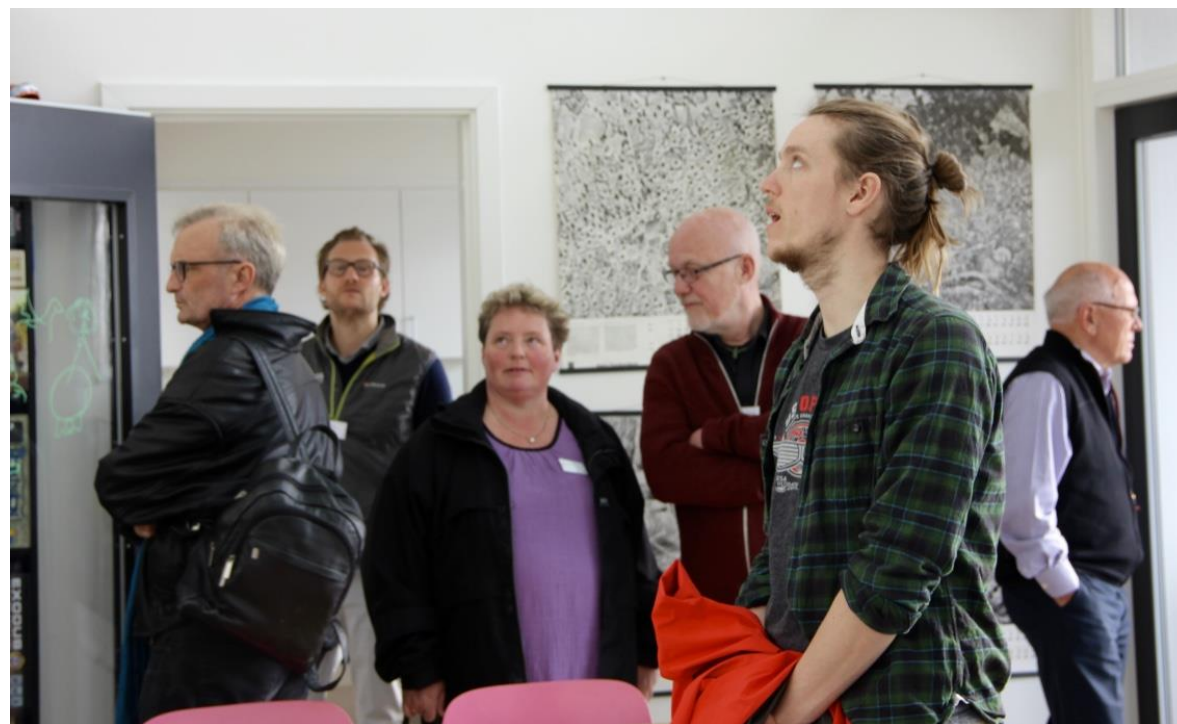
Vi besøgte bofælles- skaberne på 10. etage.